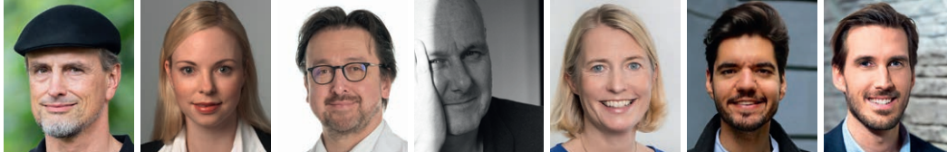
PROF. DR. JÜRGEN SCHMIDHUBER

in Zusammenarbeit mit gym | INTERLAKEN Abteilung Gstaad